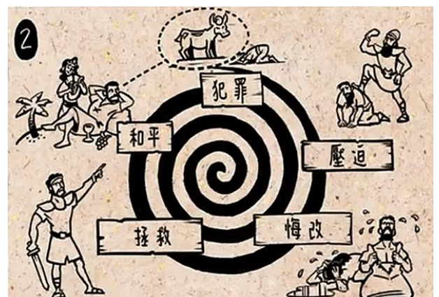
士師時代記載約 390 年